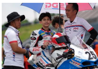
#25 SDG HARC-PRO. Honda Philippines