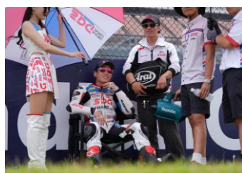
#37 Team SDG with HARC-PRO.